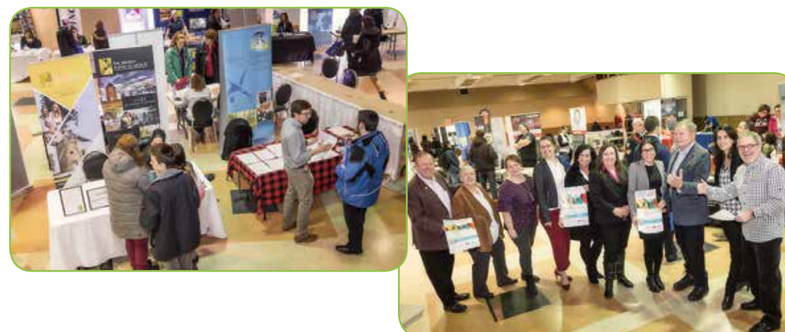
Les membres de la Table de concertation pour l'emploi de Vaudreuil-Soulanges.

La cinquième édition de la Journée Emplois Étudiants et Saisonniers, qui s'est tenue le 21 février 2018 au Centre communautaire Paul-Émile-Lépine, a connu un franc succès ! En effet, 300 personnes se sont déplacées à cette 5 e édition. Trente (30) entreprises et organismes, établis en majorité sur le territoire de la Municipalité régionale de comté (MRC) de Vaudreuil-Soulanges, étaient présents. Synergie était sur place et nous avons recueilli plusieurs CV pour nos membres.