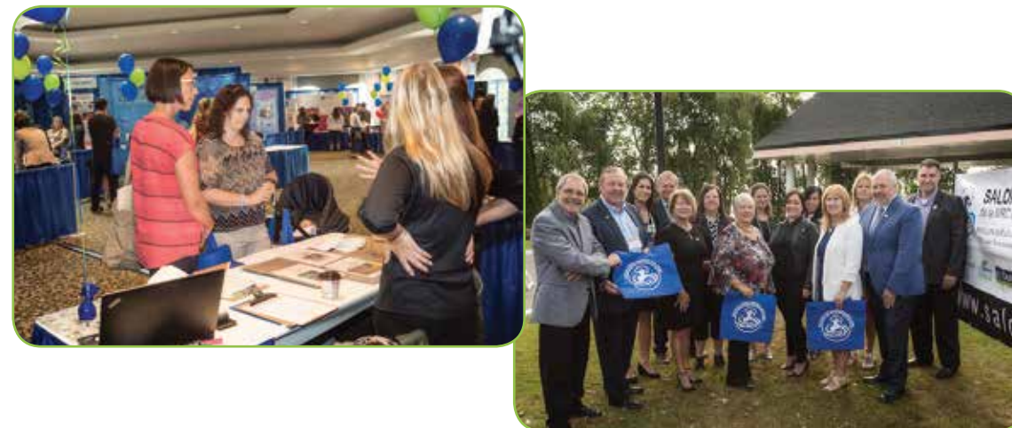
Les membres de la Table de concertation pour l'emploi de Vaudreuil-Soulanges.

Depuis 2001, le Salon de l'emploi de Vaudreuil-Soulanges est une activité incontournable pour les chercheurs d'emploi qui souhaitent travailler dans la région. Endroit privilégié pour rencontrer les employeurs de la région, cet événement connaît un succès à tous les ans.